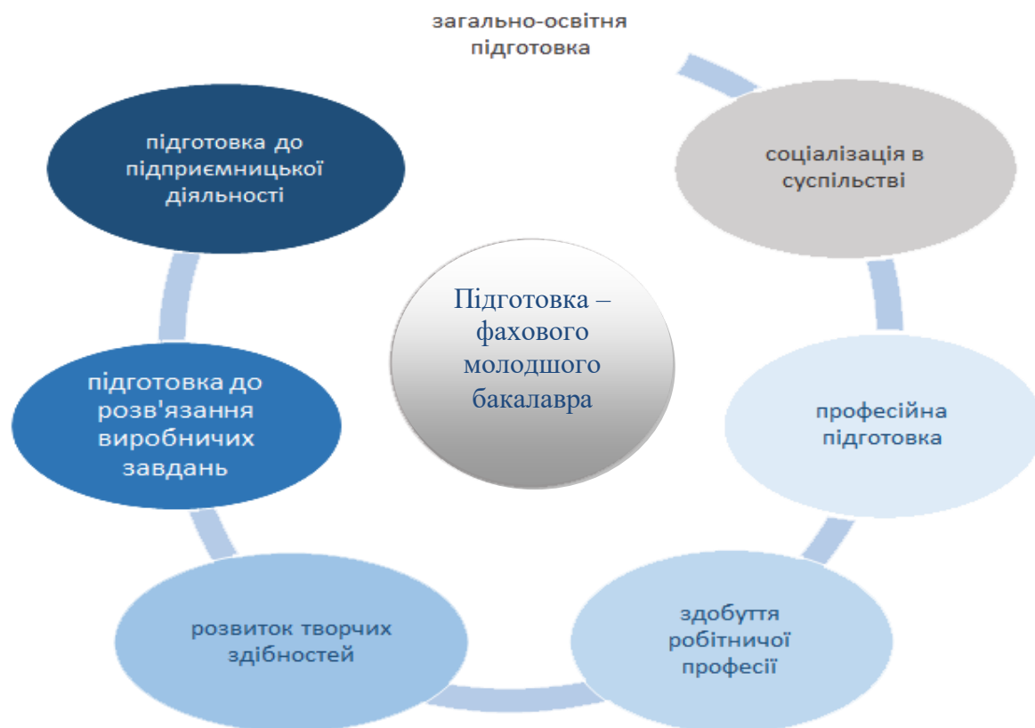
Рис. 3. Технологічна карта формування моделі студента

У найближчій перспективі необхідно передбачити: