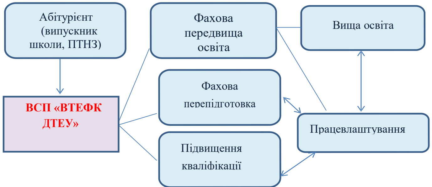
Рис. 4. Система безперервної освіти ВСП «ВТЕФК ДТЕУ»

В умовах демографічних та фінансових кризових явищ система додаткової освіти, перепідготовки, підвищення кваліфікації повинна стати широкомасштабним напрямом діяльності коледжу, одним із системоутворюючих чинників, який значною мірою визначає статус навчального закладу.