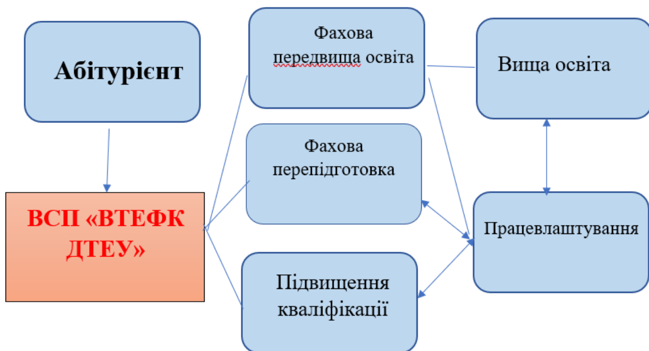
Рис. 4. Система безперервної освіти ВСП «ВТЕФК ДТЕУ»

В умовах демографічних та фінансових кризових явищ система додаткової освіти, перепідготовки, підвищення кваліфікації повинна стати широкомасштабним напрямом діяльності коледжу, одним із системоутворюючих чинників, який значною мірою визначає статус навчального закладу.