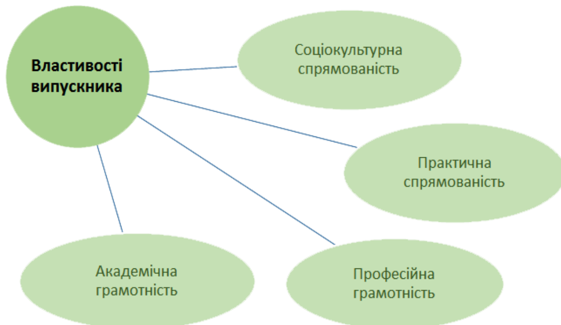
Рис. 2. Модель випускника ВСП «ВТЕФК ДТЕУ»

Формування моделі випускника ВСП «Вінницький торговельно-економічний фаховий коледж ДТЕУ», якій притаманні певні властивості, має бути однією із найважливіших складових діяльності закладу.